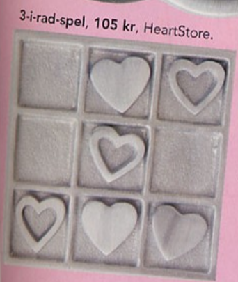
3-i-rad-spel, 105 kr, HeartStore.