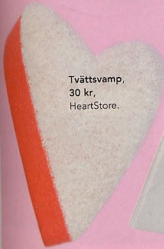
Tvättsvamp, 30 kr, HeartStore.