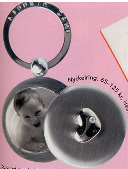
Nyckelring, 65-125 kr, HeartStore.