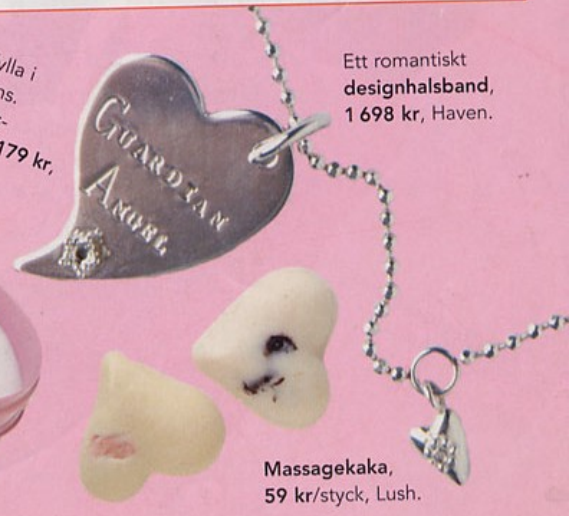
Ett romantiskt designhalsband, 1 698 kr, Haven.