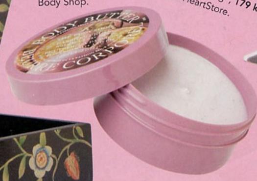
Passion fruit butter, 155 kr, Body Shop.