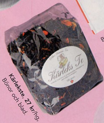
Kärleks te. 27 kr/hg. Bönor och blad.