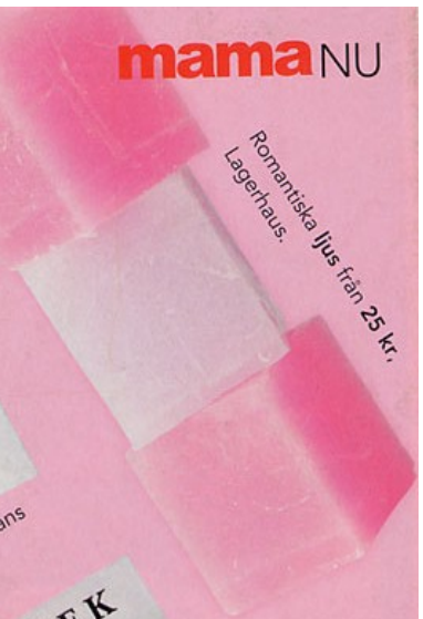
Romantiska ljus från 25 kr, Lagerhaus.