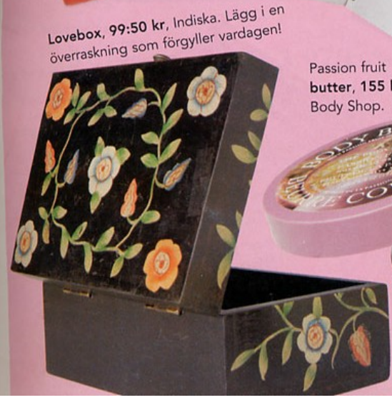
Lovebox, 99:50 kr, Indiska. Lägg i en överraskning som förgyller vardagen!

LOVE IS IN THE AIR... Nu är det mamas och papas tur! På Alla hjärtans dag ber vi om barnvakt en liten stund, eller hur...? av Anna Blomberg köpställen sidan 104