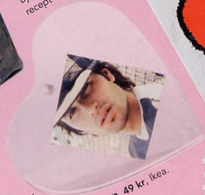
Hjärtformad fotoram, 49 kr, Ikea.