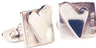
Manchettknappar, 1 750 kr , HeartStore.