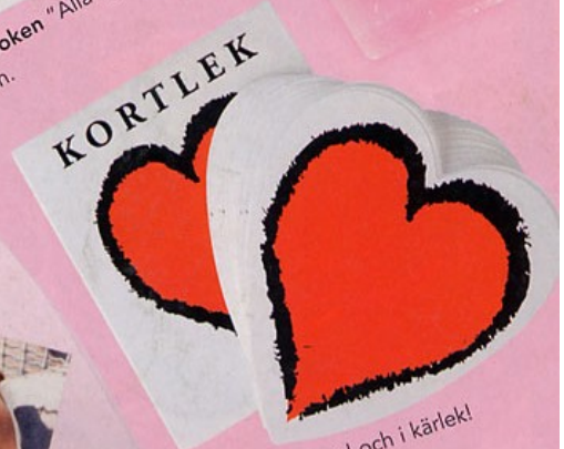
Tur i spel och i kärlek! Kortlek, 29 kr, HeartStore.